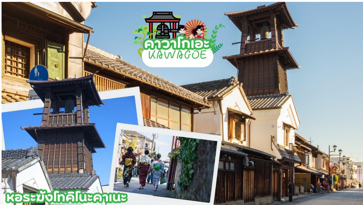
หอระฆังโทคิโนะคานะ

เดินทางสู่ คาวาโกเอะ (Kawagoe) ได้รับการขนานนามว่าเป็น ลิตเติลเอโดะ เพราะมีบรรยากาศที่มีความเป็นเมืองเก่าที่ได้กลิ่นอายโบราณทำให้รู้สึกเหมือนได้ย้อนยุค ได้สัมผัสบรรยากาศของโกดังเก่า ที่เรียงรายกันยาวตลอดระยะทางกว่า 700 เมตร ในสมัยก่อนเป็นสถานที่เก็บกักเสบียงอาหารเพื่อส่งไปให้เมืองเอโดะ (โตเกียวในปัจจุบัน) แต่ในปัจจุบันได้ถูกเปลี่ยนเป็นร้านค้า ร้านอาหาร ร้านขายของที่ระลึก ไม่ว่าจะเป็นร้านขนมที่ทำจากมันหวานสีเหลืองและสีม่วงอันเป็นผลิตภัณฑ์ขึ้นชื่อของเมืองนี้ สถานที่ท่องเที่ยวอันมีชื่อเสียงของเมืองคาวาโกเอะ